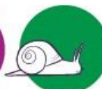
Traagheid in beslissen