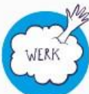
Te druk zijn