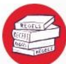
Te veel regels