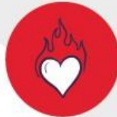
Passie & inspiratie