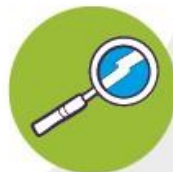
Open & nieuwsgierig