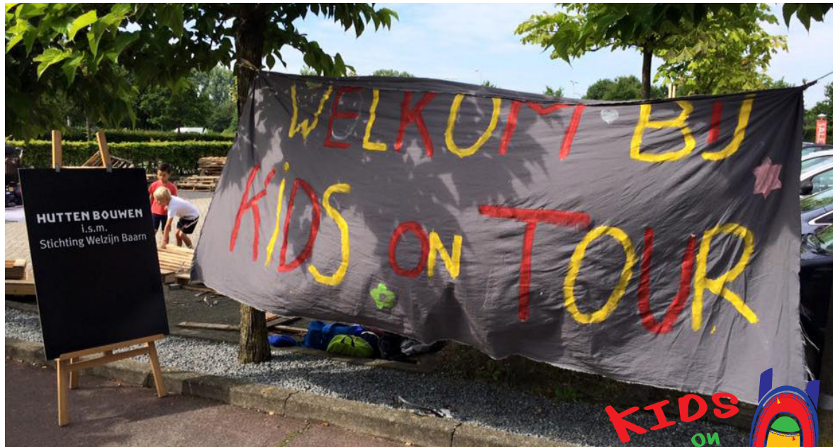
• De huttenbouw dag bij Nijhof was toch altijd een hoogtepunt van de week.

HET WAS EEN FEEST In vroeger tijden was ik in deze periode altijd al heel druk met het organiseren van Kids on Tour. Vrijwilligers regelen, (wat nooit heel moeilijk was), alle activiteiten en uitdagingen bedenken, organiseren en begeleiden. Het was altijd een feest om dit